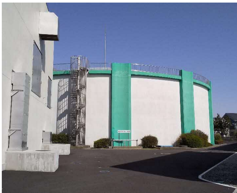
PC 配水池（吉羽浄水場）