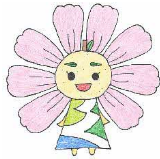
久喜市内小・中学校 マスコットキャラクター 「はぴるん」