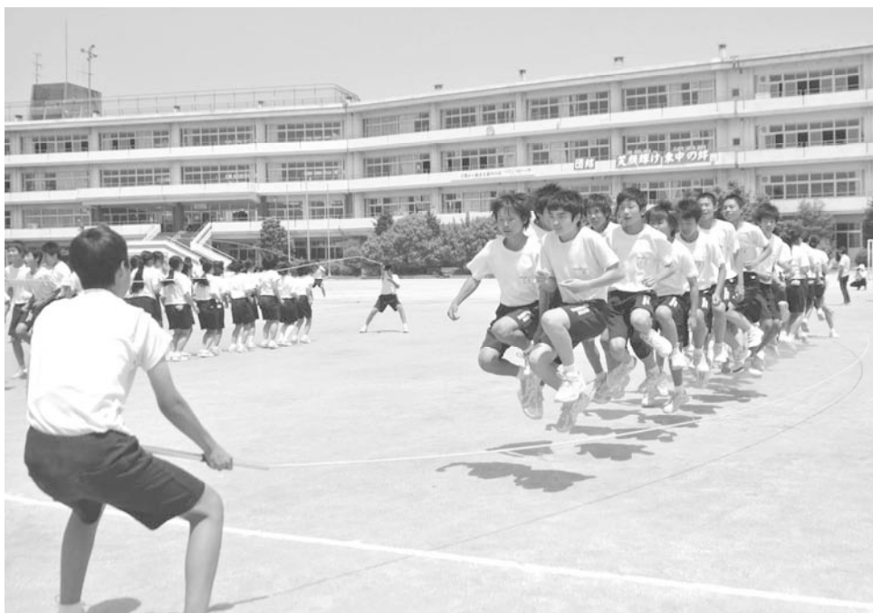
体育祭練習～みんなでジャンプ(鷲宮東中学校)