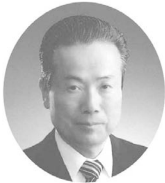
教育長 柿 沼 光 夫