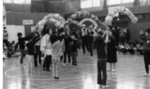
地域の方への感謝の会