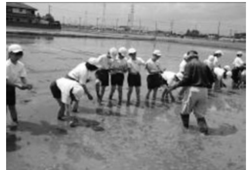
5 年生 田植え体験