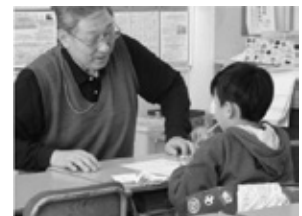
苦手克服プロジェクト (保護者・地域の学習支援)