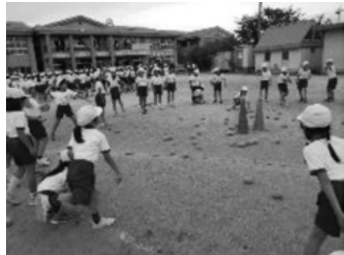
わんぱくタイム（業前運動）