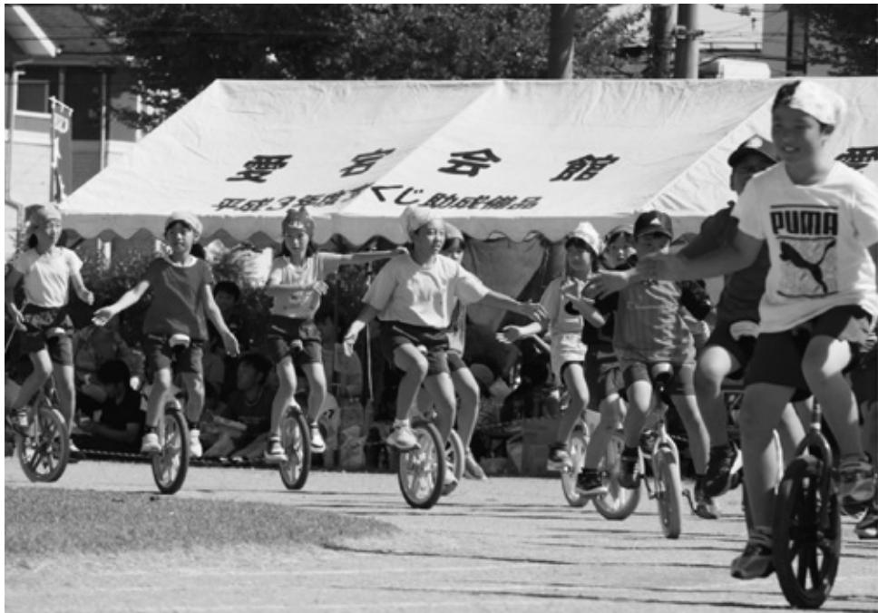
栗橋地区体育祭における一輪車演技の披露(栗橋南小学校)