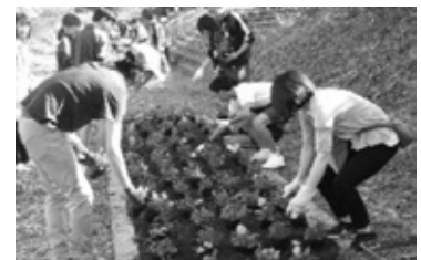
親子ボランティアによる 駅前河川敷花壇への花植え