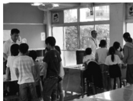
なかよし班での活動 (スタンプラリー集会)