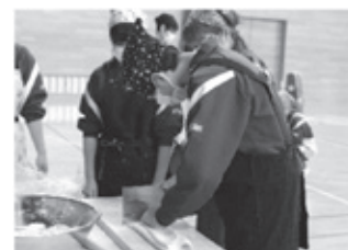
うどん打ち体験活動