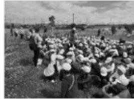
全校縦割り徒歩遠足