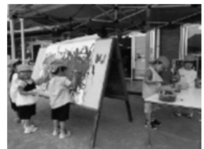
「いろんな色でぬってみよう！」