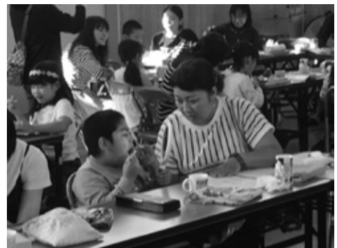
親子ふれあい活動1年生