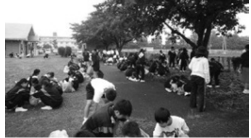
「花と香りの公園」除草ボランティア