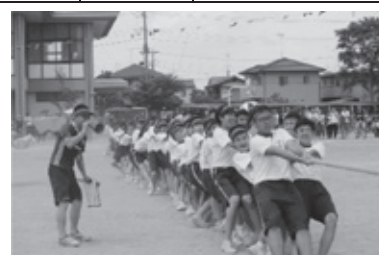
縦割り団で上級生と下級生が 一つになる綱引き