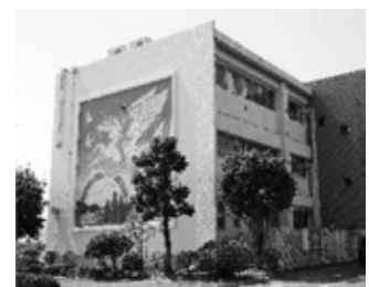
学校のシンボル ベガサス