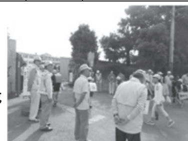
久喜小学校区生徒指導推進委員会 「あいさつ運動」