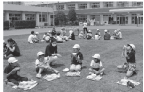
全校「芝生の上でハッピー給食」