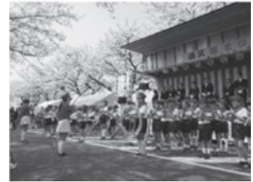
清久さくら祭り 鼓笛隊参加