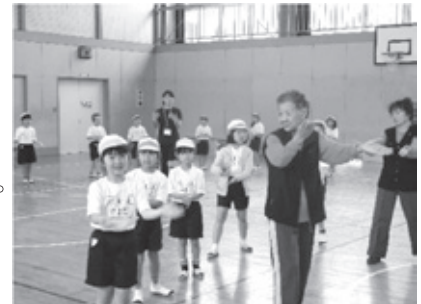
しょうぶ音頭を地域の方に 教えていただきました