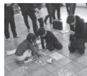
1年アンプラグドプログラミング 「ミライの遊びをしよう」