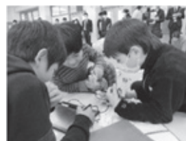
5年 ロボットプログラミング 「太田レスキュー隊」