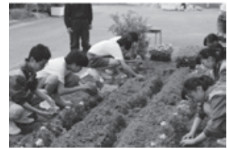
ボランティア生徒による 花壇づくり