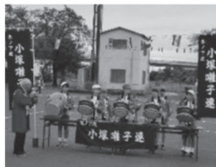
運動会のオープニングセレモニー 「小塚囃子」の演奏