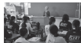
地域ボランティア「読み聞かせ」