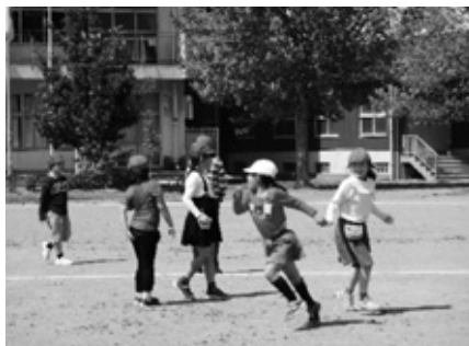
「かがやき班」での校庭遊び