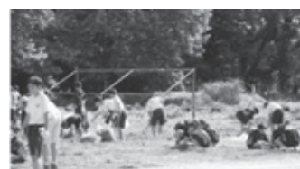
地域と生徒の協働による「ふれあい除草」