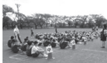
小中合同引き渡し訓練