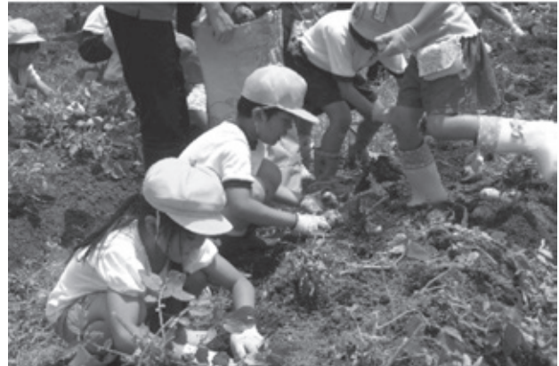
江面第二小学校とのWeプラン(1年生 生活科)