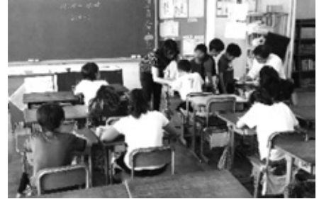
アップ学習（放課後補充学習）