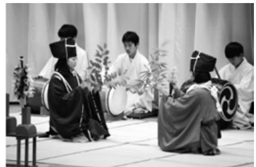
土師一流催馬楽神楽「郷土芸能部」