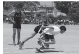
運動会の中で久喜中学校陸上部によるデモンストレーション