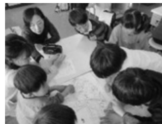
保護者とのDIG （災害図上訓練）