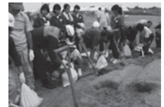
生徒と地域の 方々との交流