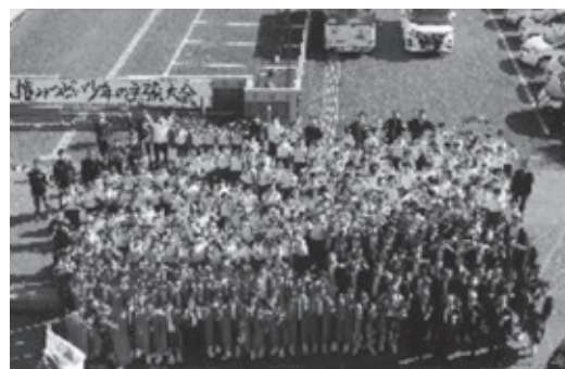
人権のつどい少年の主張大会

*今年度、「学力を伸ばす学校」に重点を置き、研究主題を「自ら学び、確かな学力を身に付ける生徒の育成」（1年次）～主体的・対話的で深い学びへの授業改善を通して～として取り組んでいる。