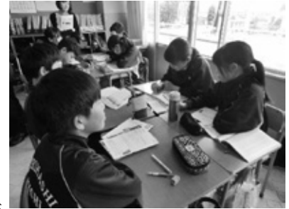
特別の教科「道徳」での話し合いの様子