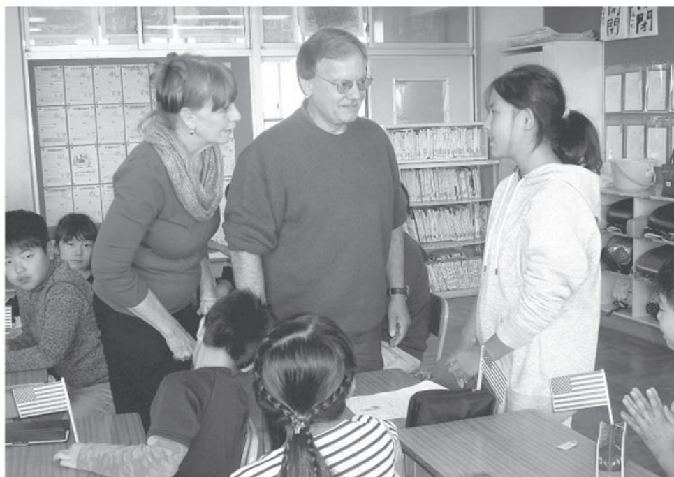
アメリカ合衆国オレゴン州ローズバーグ市との交流 (菖蒲小学校)