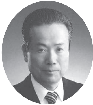
教育長 柿 沼 光 夫