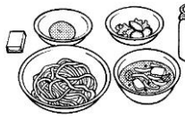
ソフトめんカレーあんかけ 牛乳 甘酢あえ 果物(黄桃) チーズ