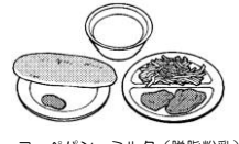
コップパン ミルク(脱脂粉乳) 豚肉の竜田揚げ せんきゃべツ ジャム

◆昭和29年に学校給食法制定されました。学校給食が食育活動の一つに位置付けられました。主食はコップパンが多くごはんや麺はほとんどでませんでした。